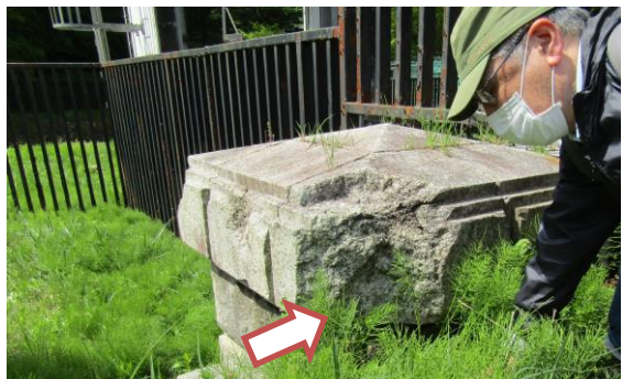
◆銃撃で砕かれたと思われる土台上部の石