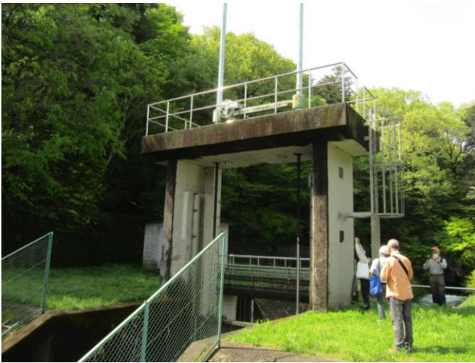
◆取水口水門を調査。この建物は建替えられていた!?

とはいえ、前回調査では気づ かなかった水門の土台上部の石 に銃撃跡と思われる傷跡を複数 発見出来たことは大きな成果だ った。詳細は別の形でまとめた いが、貴重な調査だったことを 報告したい。【事務局・中野】